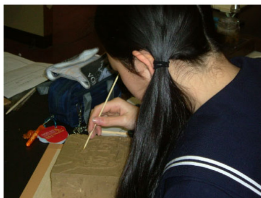
「エコ路地づくり」平成19年度 全生徒、教職員、保護者が参加したエコ路地づくり。環境に関することをレンガに彫って敷き詰める。