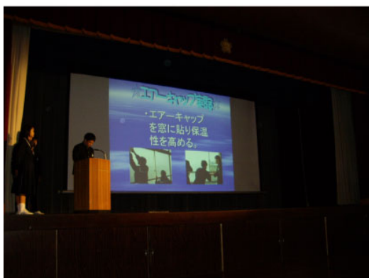
「1年生の学習発表会」平成18年度 クラスごとにテーマを決めて小グループをつくり、調査実験した結果を学習発表会で発表。